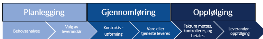
Figur 1: Anskaffelsesprosessen. Formålet med standarden er å ivareta samtlige ledd i prosessen.

Gjennom «Standard for innkjøp i SpareBank 1 SMN» er det etablert et rammeverk ved anskaffelser som skal sikre en helhetlig oppfølging ved anskaffelsesprosessen: