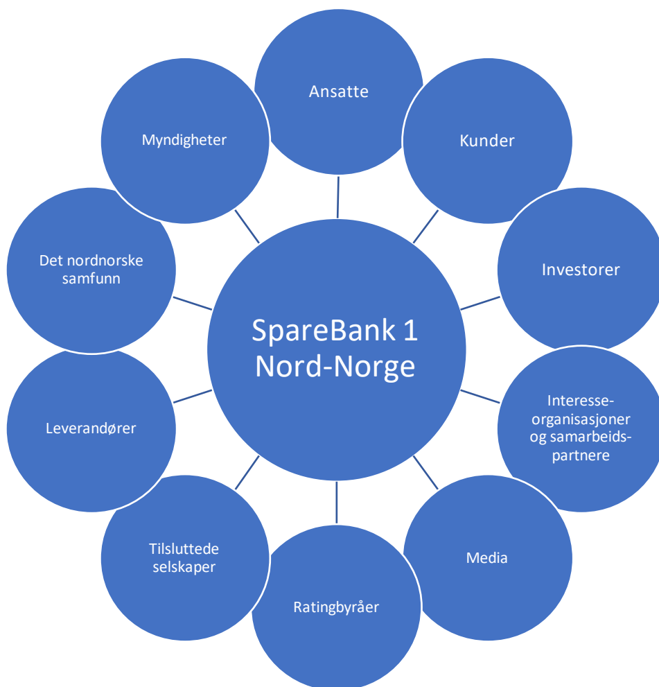
Figur 1: Oversikt over SpareBank 1 Nord-Norges viktigste interessenter

Intervjuene og spørreundersøkelsene har blitt supplert med større arbeidsmøter, samt rapporter og artikler fra blant annet Kunnskapsbanken for å skape et helhetlig bilde av hva våre interessenter anser som mest vesentlig for konsernet.